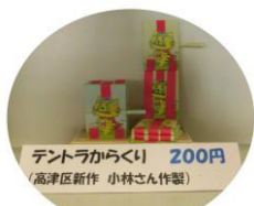
テントラからくり 200円 (高津区新作 小林さん作製)