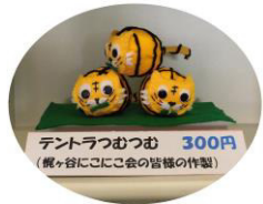
テントラつむす 300円 (親ヶ谷にこにこ会の皆様作製)

高津区社会福祉協議会がすすめているおたっしゃ10のトライ(健康推進運動)のマスコットキャラクターテントラちゃんのグッズを、地域の方々に作っていただきました。 そしてこのたび、そのテントラちゃんグッズの販売が福祉パルたかつにて始まります。お越しの際には、ぜひお手にとってご覧ください。 【問合せ】高津区社会福祉協議会 地域課 電話044-812-5500・FAX044-812-3549