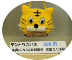
テントラさいはら 500円 (家長いこいの家利用者 吉田さん作製)