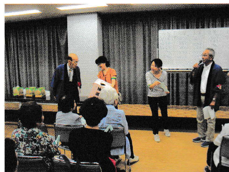
抽選会でのくじ引き