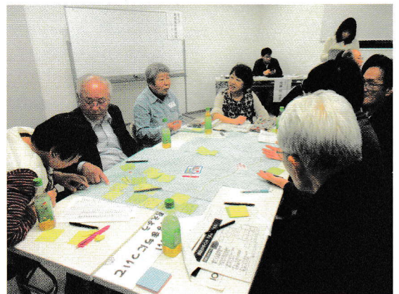
リラックスした雰囲気での懇談会

その後、この会で学んだことを継続させるため、年明けに二子・諏訪地区で地域住民に対して町会等の参加が今までなかった方々を含めて「身近なことを話し合える場」への参加を募りました。そして、「人生100年会」と称した会に約20名の方が集い、足湯に浸かってのおしゃべりや、カラオケやお茶を飲み、最後は炭坑節を踊って、きっかけ作りができました。その後も、“できることから”を念頭に継続しており、9月に3度目を開催予定です。