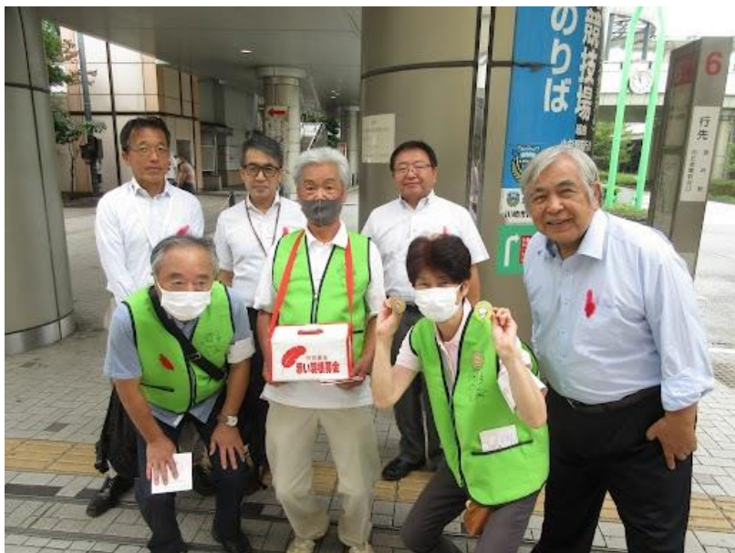
東急ストア溝の口駅前