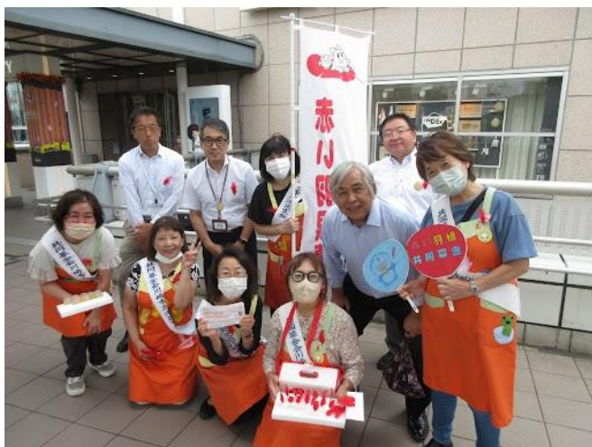
溝の口きらりデッキのノクティ前