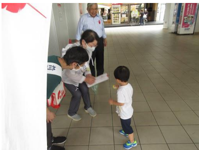
小さなお子さんも募金に協力してくれました。

武蔵溝ノ口駅や高津駅、梶ヶ谷駅、二子新地駅など各駅頭でボランティアの皆さんが通行中の方々に「赤い羽根の募金にご協力を」と呼びかけました。