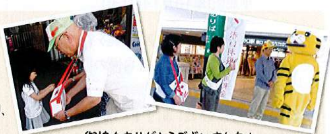
御協力ありがとうございました!

今年もキラリデッキ(JR・東急口)、梶が谷駅等において、街頭募金活動を行いました。多くの通行された皆様より、温かい善意あふれる寄金があり、活動への励みとなりました。