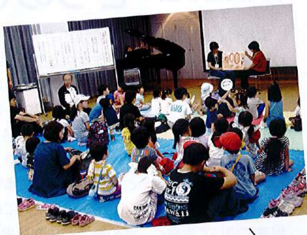
うんとこしょ、どっこいしょ

大型絵本「どうぶつサーカスはじまるよ」のお話から始まり、今ではあまり見ることのない16ミリ映画で「ウサギとカメ」や「3びきのこぶた」を楽しみ、スタッフによる童謡バージョンの「南京玉すだれ」の妙技に見とれ、エプロンシアターの「大きなカブ」では「うんとこしょ、どっこいしょ」の大合唱となりました。親もスタッフもみんな童心に返って子どもと一緒に楽しみ、あっという間の1時間半でした。