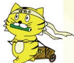
マスコットキャラクター「テントラちゃん」

オリジナルテーマ曲、オリジナル体操、マスコットキャラクター「テントラちゃん」を活用した、区民への健康運動の普及啓発を図ります。