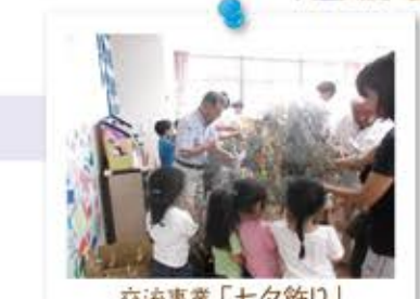
交流事業「七夕飾り」