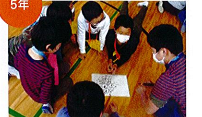
近隣小学校との交流