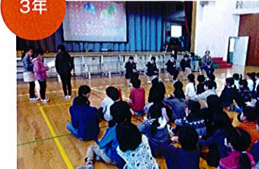
南武朝鮮学校との交流