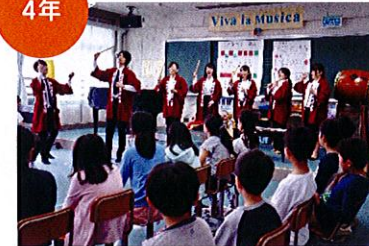
洗足学園の学生さん