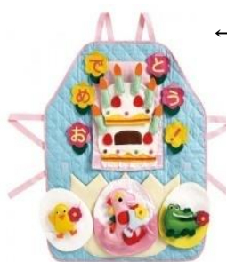
←エプロンシアター 「おたんじょうびおめでとう」

高津区内で子育て支援活動をする関係機関・団体（※）に“無料”で遊び道具や大型絵本などをお貸し出ししています。ぜひご利用ください。貸出期間は7日間以内となっています。（※事前に高津区社協に団体登録をお願いします）